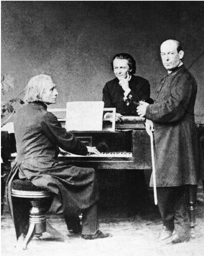
Зліва направо: Ференц Ліст, Нандор Плотені, Еде Ремені

Одна з останніх їх зустрічей відбулася весною 1886 року на родинному святі Плотені з нагоди завершення будівництва нового палацу. Ліст бере участь у закладанні парку з рідкісних видів декоративних дерев поблизу палацу, виступає з концертами на графському балконі у Великих Лазах та в залі Ужгородської філармонії. На знак великої поваги до угорського музиканта Плотені в 1929 році опублікував про нього спогади 15 , а свій найзначніший твір – «Угорський концерт» – присвятив Лісту.