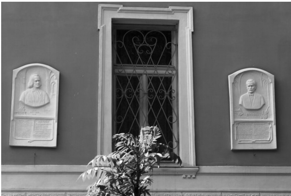
Меморіальні дошки Лісту та Плотені у Великих Лазах