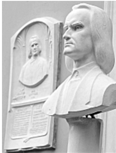
Погруддя Лісту в маєтку Плотені (Великі Лази)